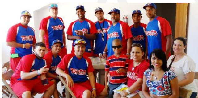
Actividad Benefica Zona Coayuco