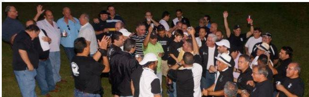
Becerrada: Zona Arasibo