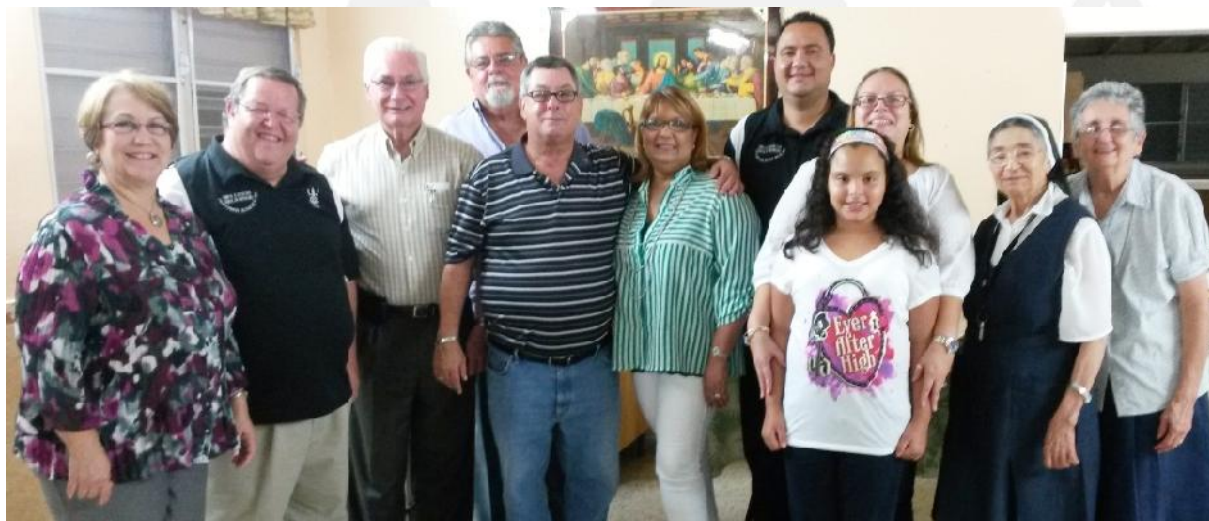
Actividad Benéfica Zona Majagua: Hogar Escuela Sor María Rafaela