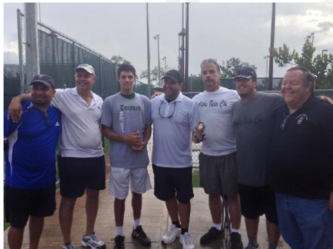
Torneo de Tennis Rebecca Colbert: Zona Yahueca