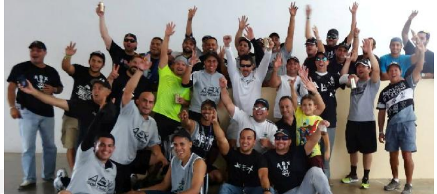
Actividad Benefica Zona Coayuco