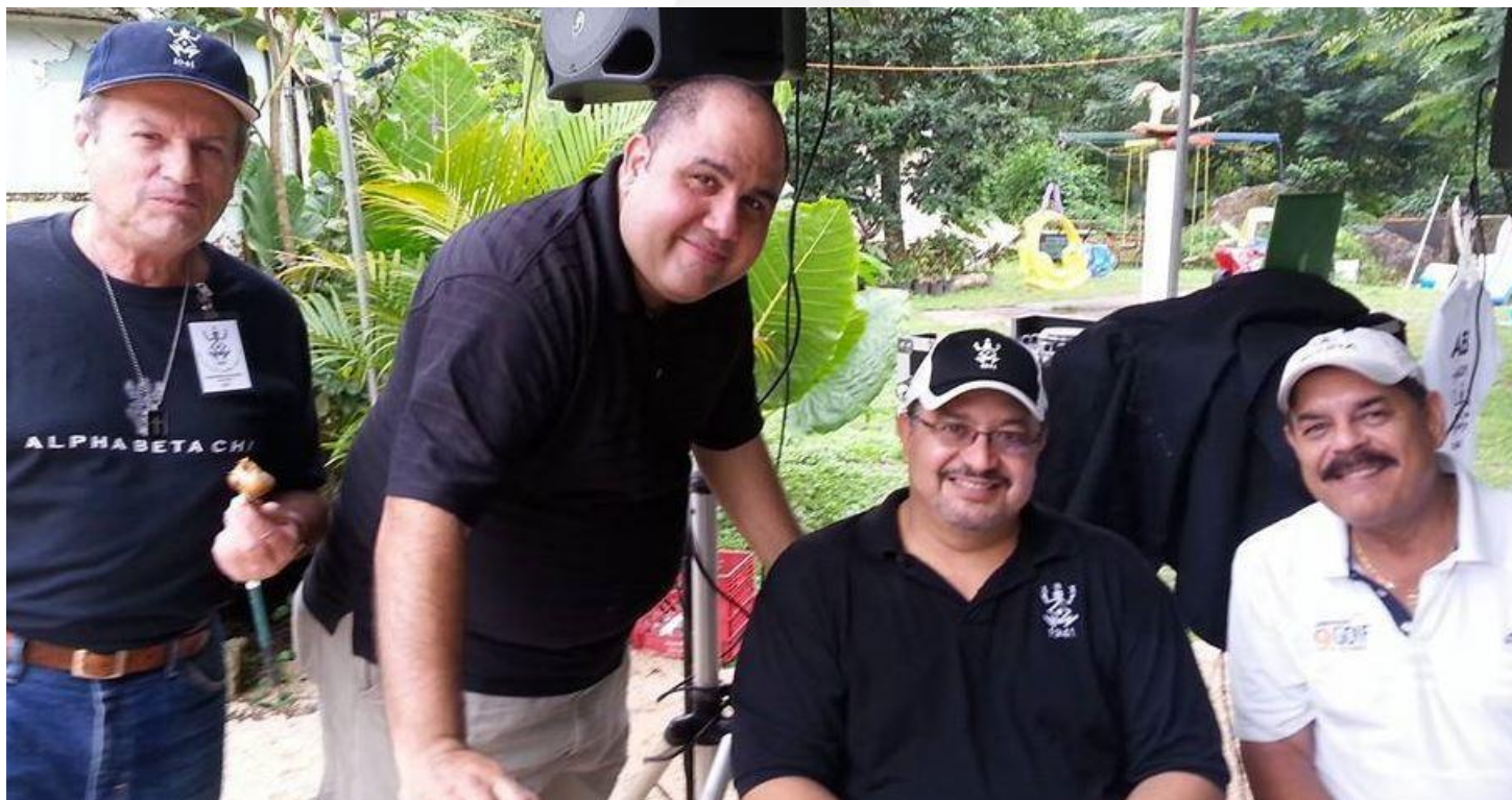
Actividad Retorno de la vieja guardia: Zona Guainia