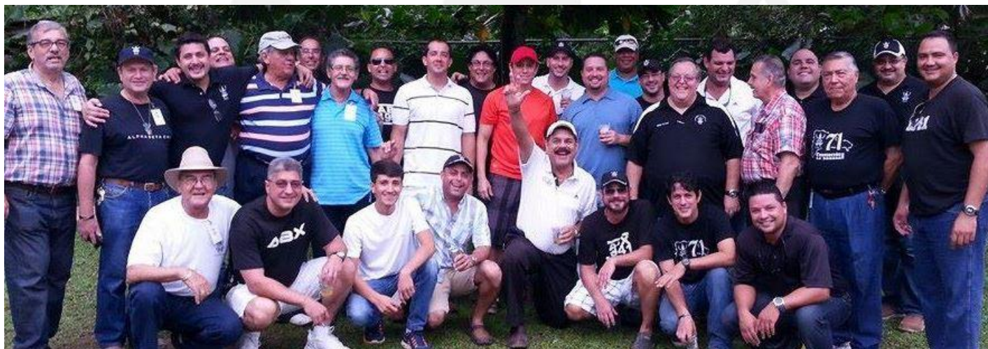
Actividad Retorno de la vieja guardia: Zona Guainia