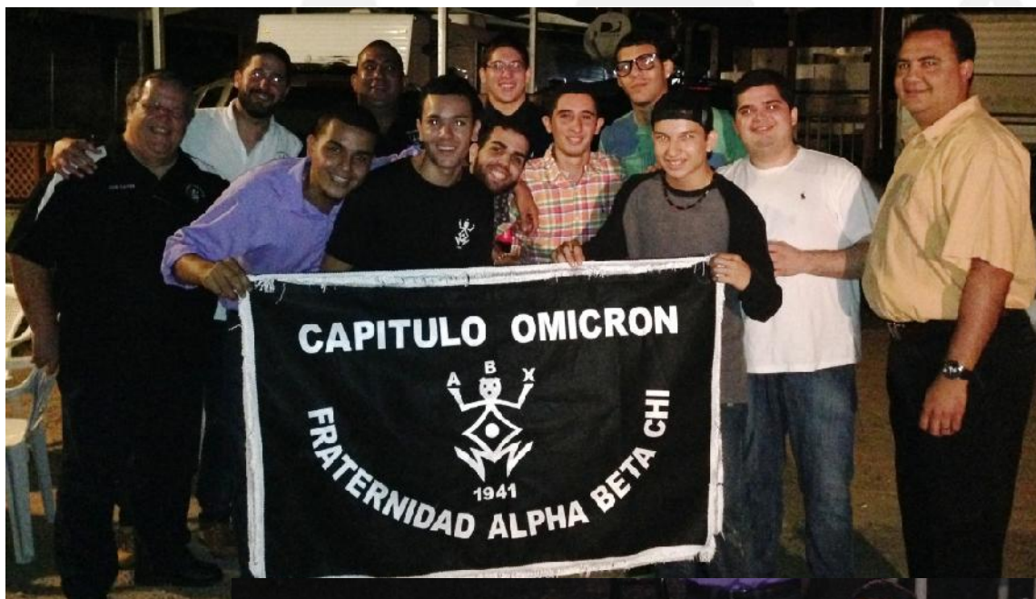
Smoker y Reunion Capitulo Omicron